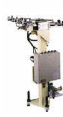
左右スライドテーブル SF-300